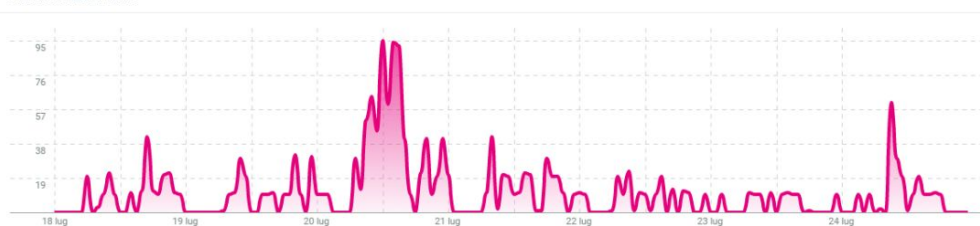
MENTIONI NEL TEMPO